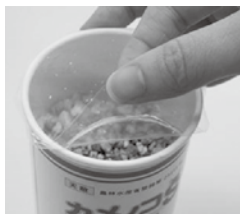
内蓋(フィルム)をめくる