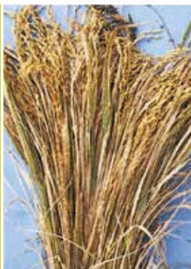
穂枯れ(ごま葉枯病菌)