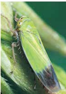
ツマグロヨコバイ