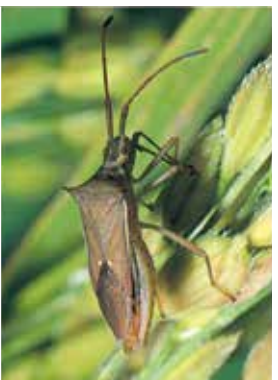
ホソハリカメムシ