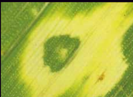
ノンブラス処理による不活性病斑